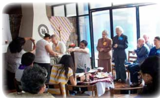
El compartir de los grupos, durante la homilía