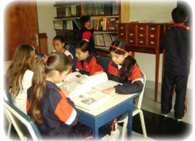
Alumnos en la biblioteca del colegio