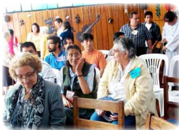
Preparando la Eucaristía